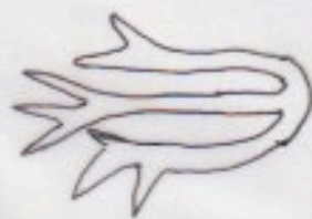
ヒルギ 上部 (枝)