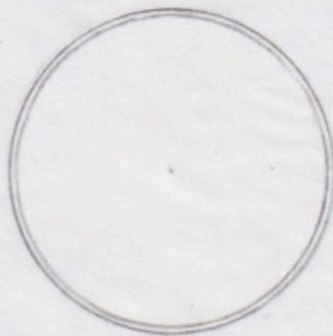
直径 6cm (内側の円)