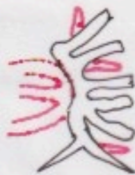
ヒルギ 下部 (支柱根)